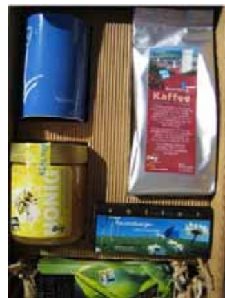
Ein Geschenk, das verbindet: Fairer Präsentkorb der Stadt Ravensburg

lensak: „Für Alters- oder Ehejubiläen und sonstige Gastgeschenke verwenden wir einen Präsentkarton mit fair gehandelten Produkten. Damit setzen wir bewusst ein Zeichen und verschaffen dem fairen Handel mehr Aufmerksamkeit. Insgesamt kommen so an die Tausend faire Präsentkartons pro Jahr unter die Leute.“